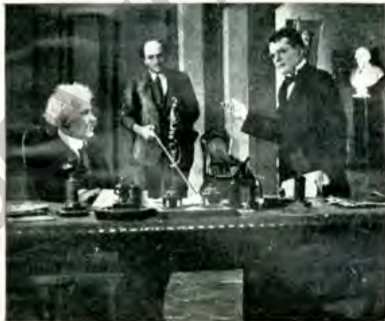
В директора театру. З фільму „Напередодні“.