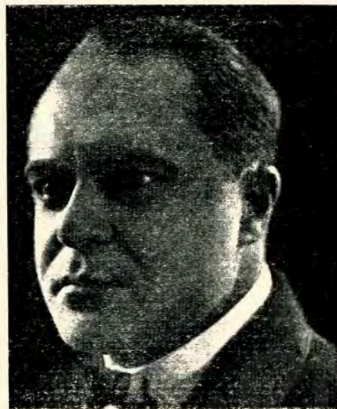
Режисер А. Анощенко

Під вражінням слів Петра, а також бачучи переконаність його товаришів, що вмирають за праве діло, Катя починає розуміти свою помилку і переймається спочуттям до комсомольців. Декілька десятків комсомольців бандити виводять на кручу над Дніпром і, розстрілюючи їх тут, скидають у річку з величезної височини. Катя, перед очима якої діялася ця жахлива страта полонених, постановивши вра-