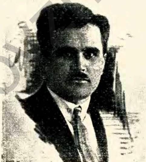
Автор сценарія Г. Елік